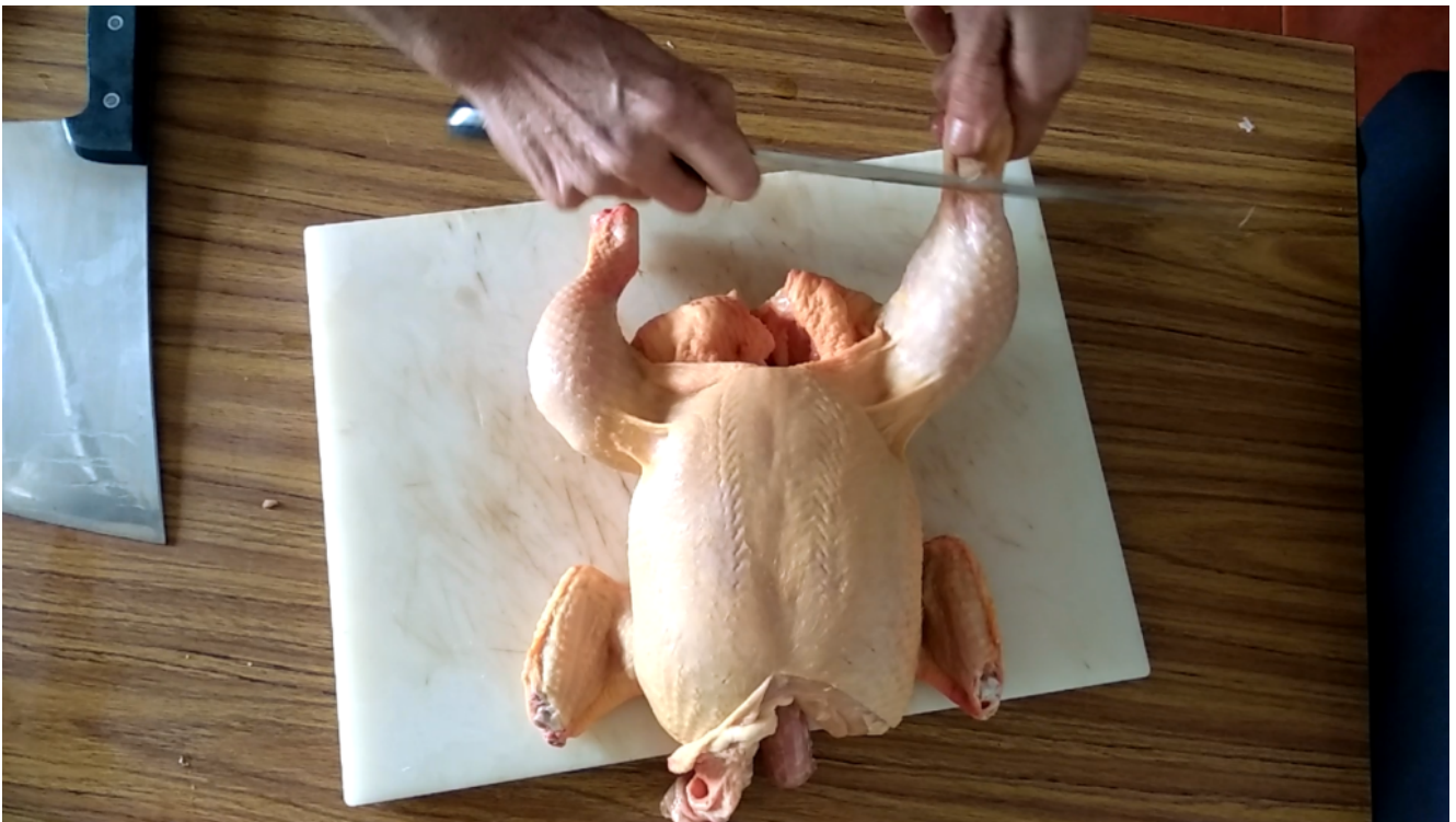
Corte alrededor del hueso del muslo

A continuación, retira es el hueso del muslo, para que sea fácil de extraer, tienes que hacer un corte alrededor del hueso por la parte más próxima a la pata. Sujeta el contra muslo con una mano y con la otra toma la punta del hueso del muslo y has una rotación para desprenderlo de la articulación que une muslo y contra muslo, tira un poco y sale con facilidad. Repite lo mismo con el otro muslo.