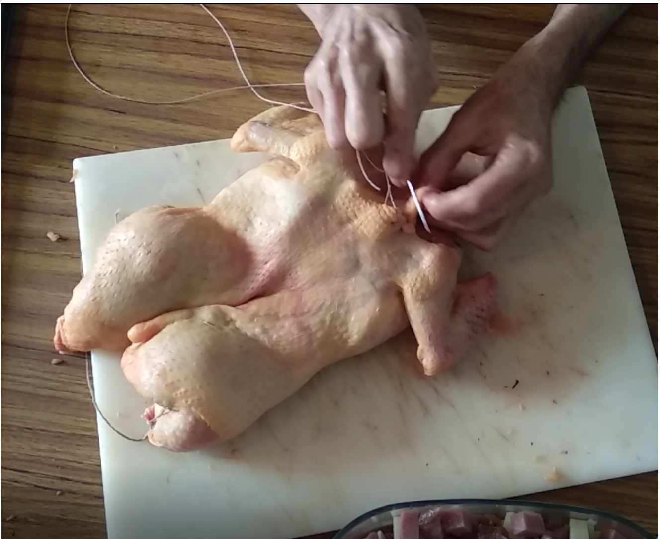
Atado del pollo para que no salga el relleno

Prepara el pollo deshuesado para el relleno, con aguja e hilo cerramos la abertura de los muslos. Con la piel que dejamos del cuello cerramos la abertura que quedo para evitar que el relleno se salga.